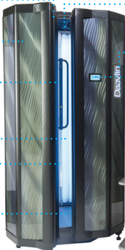
Plate-forme amovible surélevée pour le traitement des extrémités inférieures.

Ventilateurs de refroidissement pour le patient. Le haut-parleur fournit des messages audibles pour informer et rassurer le patient. Disponible en plusieurs langues. Personnalisable par patient.