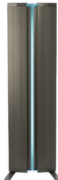
Série-7 avec 4 panneaux qui se rabattent pour protéger les lampes.