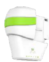
9.0 mm-Kartusche (Körper)