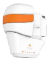
3.0 mm-Kartusche (Gesicht)