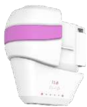
1.5 mm-Kartusche (Gesicht)

Zur Behandlung von Gesicht und Dekolleté mit „Lifting“-Effekt.