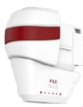
4.5 mm-Kartusche (Gesicht)