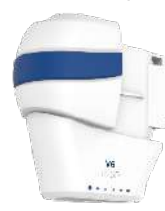
6.0 mm-Kartusche (Körper)

Um unschöne Wölbungen zu reduzieren und die Hautspannung wiederherzustellen.