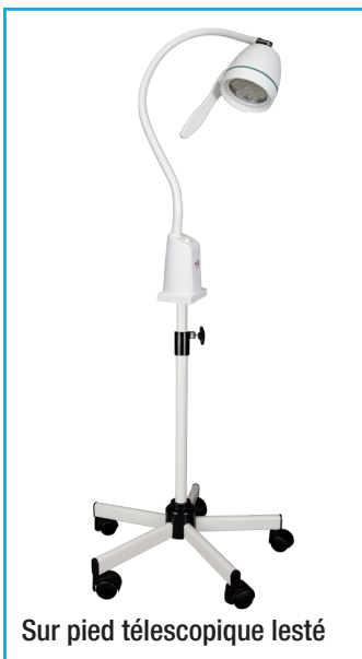
Sur pied télescopique lesté