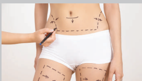
Indication de la zone à traiter