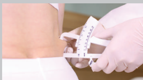
Mesure de la zone à traiter

La zone traitée sera engourdie lorsque les applicateurs seront retirés. Votre praticien effectuera alors un massage de la zone pendant 5-10 minutes immédiatement après la procédure.