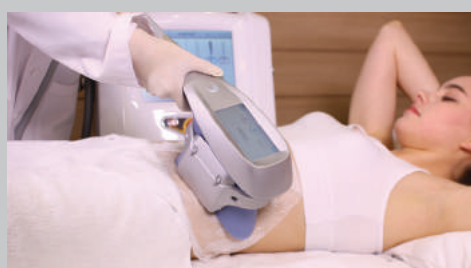
Application des pièces à main