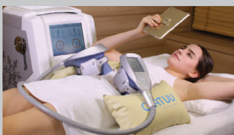
Durée du traitement : 40 à 60 minutes